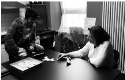
Wir spielen Triominos

Während der Osterferien ist der Jugendtreff Mars wie gewohnt geöffnet.