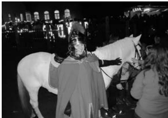
St. Martin 2016

Die Kindertagesstätte Karolusheim lädt auch in diesem Jahr am Samstag, den 11.11.2017 zur traditionellen St. Martinsfeier ein. Beginn ist um 17 Uhr in der Kirche St. Stephanus. Der anschließende Laternenzug durch Laudenbach wird unterstützt durch den Musikverein Harmonie und die Freiwillige Feuerwehr Laudenbach. Abschluss ist im Hof des Karolusheim mit Bewirtung durch den Elternbeirat und das Team der Kita.