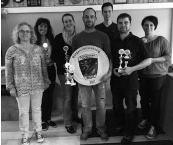
Das Bild zeigt die diesjährigen Gewinner der Kleinheubacher Ortsmeisterschaft und dem Bürgerschützenkönigsschießen.

Schützenverein Kleinheubach bietet demnächst auch Bogenschießen an.