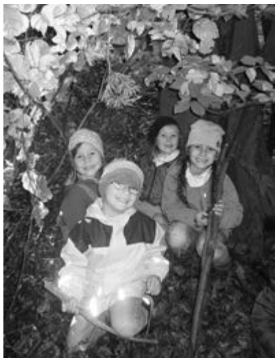
Text & Fotos: KiTa Regenbogen

Jeden Tag ging es zu Fuß den Berg hinauf zum Galgen, wo das „Basislager“ aufgeschlagen wurde. Danach blieb den Kindern genügend Zeit zu entdecken, zu toben und auszuprobieren. So wurden Tipis gebaut, verschiedene Käfer, Würmer und Vögel beobachtet und Bäume und Pflanzen kennengelernt.