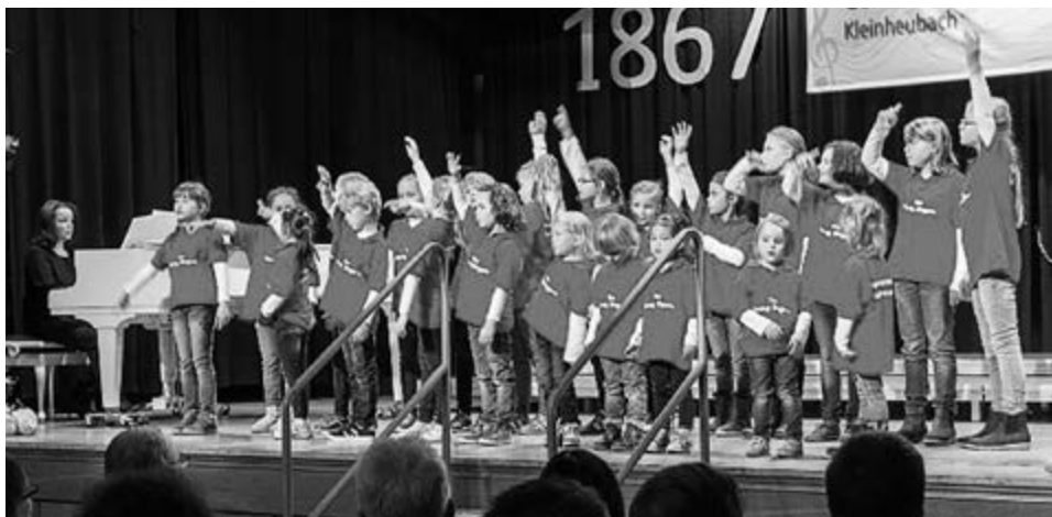
The Young Singers

Auch der Männerchor Schneeberg verstand es ausgezeichnet, den Schubertschen „Abendfrieden“ und „Wach auf mein Herzens Schöne“ sanft und lyrisch zu Gehör zu bringen. Mit Stücken aus der Klassik und dem Barock beendete das Ludwigsburger Blechbläsersextett sehr festlich und eindrucksvoll gespielt und mit viel Beifall belohnt den 1. Teil des Konzerts und entließ die Besucher in die Pause.