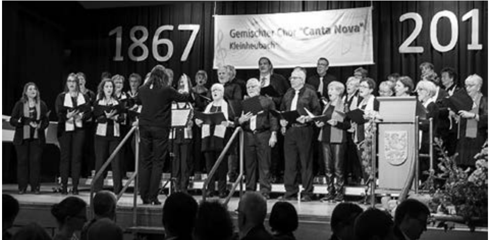
Chor Cantata Nova

Zu einem ganz besonderen Ereignis hatte der Gemischte Chor „Canta Nova“ am 21.10.2017 in den Kleinheubacher Hofgartensaal eingeladen – zum Jubiläumskonzert anlässlich seines 150-jährigen Bestehens. Ein liebevoll herbstlich geschmückter Saal und ein außerordentlich vielseitiges Programm erwartete die zahlreichen Konzertbesucher.