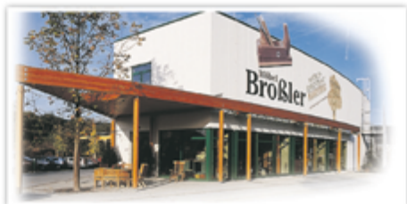
Möbel Broßler, Industriestraße 20 in 63920 Großheubach

sowie Markenküchen bis zum 1/2 PREIS angeboten, PLUS zusätzlich 200,- Euro Räumungsprämie auf alle bereits im Preis reduzierten Ausstellungsmöbel und -küchen*.