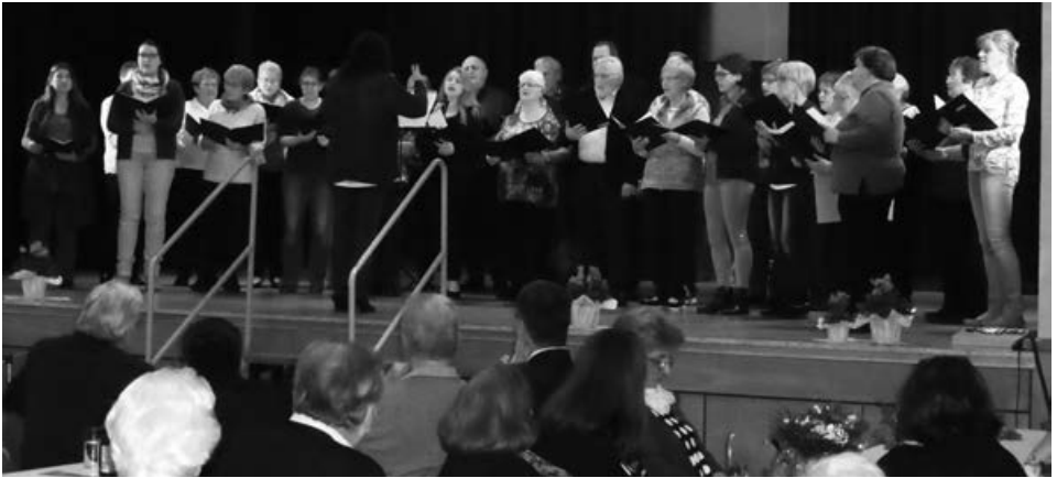
Gemischter Chor Kleinheubach

Einen geselligen Nachmittag mit Vorträgen, Gesang und Musik hatten die Seniorinnen und Senioren beim Seniorennachmittag der Marktgemeinde Kleinheubach im Hofgartensaal.