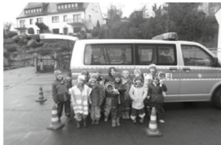
Text & Fotos: Kindertagesstätte Karolusheim