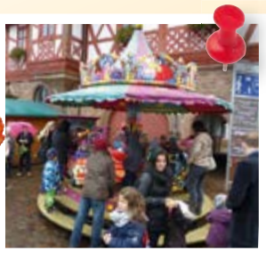
Kinderkarussell für die kleinen Besucher